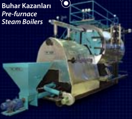
Ön Ocaklı Buhar Kazanları Pre-furnace Steam Boilers