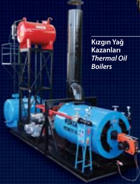
Kızgın Yağ Kazanları Thermal Oil Boilers