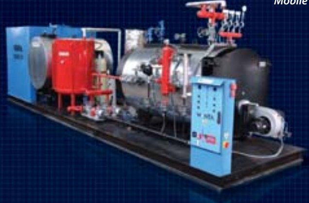
Mobil Buhar Kazanı Mobile Steam Boiler