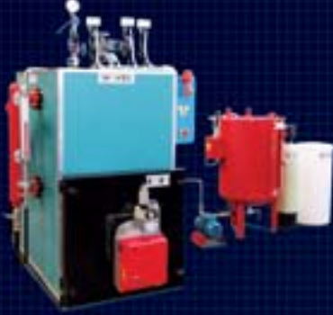
Mekatronik Buhar Jeneratörleri Mechatronic Steam Generators