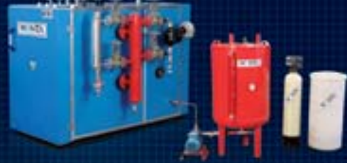
Elektrikli Mekatronik Buhar Jeneratörü Electrical Mechatronic Steam Generators